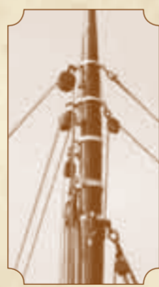
Oplossing in het volgende VHZC Scheeps Journaal.

Wolf-Dieter 'Bubi' Gerdaud, Eckernförde.