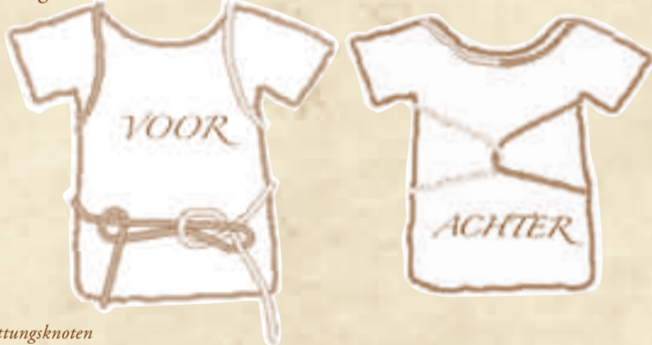
Lijkknop / Rettungsknoten

Eerst wordt in de tamp een oog gelegd waarna de tap van anderen af door het oog gehaald en achter het staande part om van boven naar onderen door het oog wordt gestoken. Wordt het vaste oog om de eigen tros gelegd, dan krijgt men een lopende paalsteek die kan worden vastgetrokken. De steek is goed geschikt voor het redden van personen. Hij moet dan wel gezekerd worden met een halve slag.