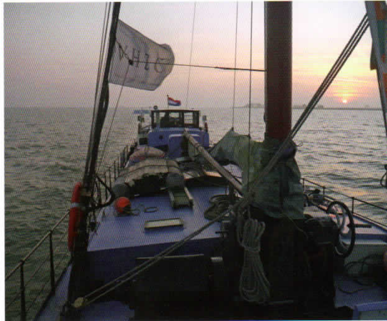
Sfeerfoto van de Quo Vadis op het Markermeer met gestreken zeil

Met een wereldwijde stijgende vraag naar energie, de daarbij behorende prijsstijging en de milieuproblematiek neemt de behoefte aan alternatieve en schonere energie toe. De redactie van Aandrijftechniek ging voor een dag aan boord van het klassieke schip Quo Vadis van de VHZC (Verenigde Hollandse Zeil Compagnie). Onderweg van Amsterdam naar Enkhuizen liet ze zich informeren over het project Fair Energy.